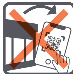
QRコードをお店の外に持って 行って使うこと