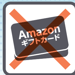
プリペイドカード (Amazonカード・itunesカード等)