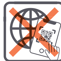
インターネット決済の販売で QRコードを使わせること