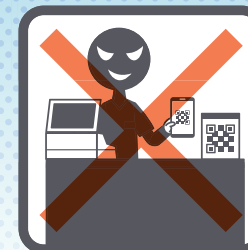
自店の架空売上の決済