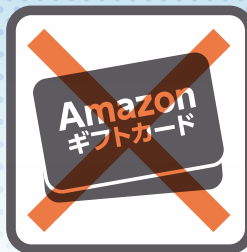
プリペイドカード (Amazonカード・itunesカード等)