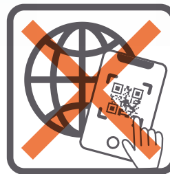
インターネット決済の販売で QRコードを使わせること