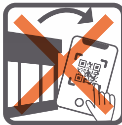
QRコードをお店の外に持って 行って使うこと