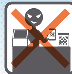
自店の架空売上の決済