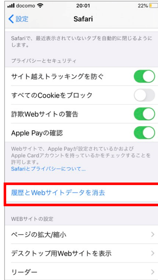
「履歴とWebサイトデータを消去」を選択