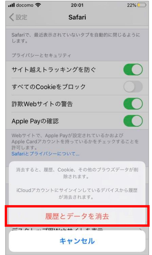
「履歴とデータを消去」を選択後、完了

* iPhoneはブラウザキャッシュをクリアするとカメラキャッシュもクリアされます